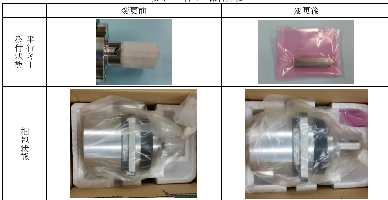
表1 平行キー添付方法